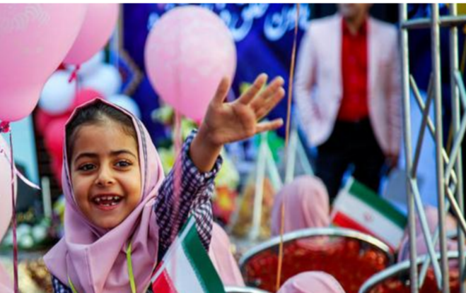
ابتدایی و جشن جوانه ها مربوط به پایه هفتم است که روز ۲۹ شهریور ماه برگزار می شود و استان ها باید برای این روز برنامه ریزی خود را انجام یابند.