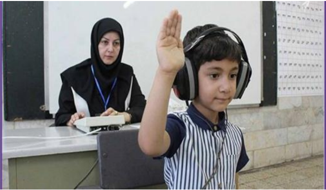
آمدگی تحصیلی نوآموزان در تابستان انجام می‌شد، شاهد یک بیک سنجین در اواسط شهریور بودیم اما چون سنجش سلامت در سال جاری

وی اضافه کرد: در طول شهریور، این مراکز باز هستند و نوبت گیری و سنجش‌آموزان در این مراکز انجام می‌شود؛ البته در طول ماه مهر نیز اگر دانش‌آموزی مانده باشد، با مراجعه به این مراکز سنجش او انجام می‌شود.