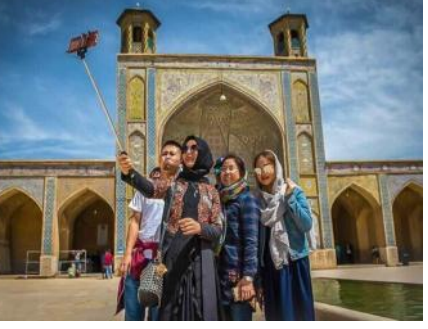
شرکت های بزرگ رزرواسیون هتل و تعدادی از هتل های بین المللی در آن حضور داشتند.