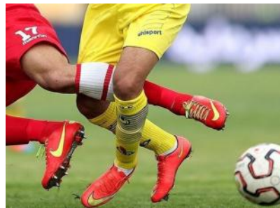
مس سونگون ورزشقان و خیبر خرم آباد در چارچوب هفته سوم لیگ یک فوتبال به مصاف همدیسگر می روند. مس سونگون ورزشقان و خیبر خرم آباد در چارچوب