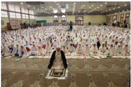
حضرت فاطمه زهرا (س) و برای پسران ۲۳ دی ماه الی ۴ بهمن (ختم به میلاد امام علی(ع)) است.

دانش‌آموزان تازه مکلف شده را، گامی مهم در راستای رشد ساخت اعتقادی آنان بنابر اهداف سند تحول بنیادین دانست و خاطر نشان کرد: جشن تکلیف دانش‌آموزان استان به تفکیک دختران و پسران نو مکلف به استناد شیوه‌نامه برنامه‌های فراگیر پرورشی به صورت حضوری در مدارس، مساجد، بقاع متبرکه و سایر اماکن مذهبی و فرهنگی شهر و روستا برگزار می‌شود. مدیرکل آموزش و پرورش آذربایجان شرقی در خصوص جزئیات زمان برگزاری جشن تکلیف، گفت: زمان پیشنهادی برگزاری جشن تکلیف دختران، ترجیحاً از ۹ الی ۲۰ دی ماه (ختم به میلاد