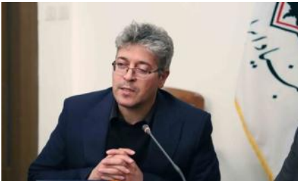
مؤلف مجموعه کتب تاریخ مطبوعات آذربایجان با بیان این که استاد رئیس نیا مرجع تاریخ مطبوعات ایران است، تأکید کرد: همه پژوهشگران تاریخ مطبوعات ایران از استاد رئیس نیا به‌عنوان فردی مطلع و محل اعتماد و مراجعه یاد می‌کنند.