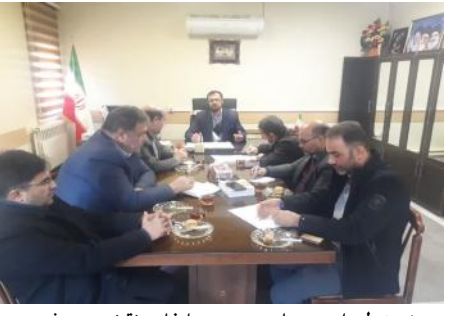
حوزه تولیدات صنایع دستی و ایفای نقش موثر در رونق تولید و اقصا روستا خواهد داشت.

جمهوری و برای ایجاد رونق در تولید و اقتصاد روستایی و تقویت زنجیره ارزش، بر اهتمام جدی برای شناسایی و معرفی تولیدی ها و شرکت های مستعد و توانمند مرتبط با زنجیره ارزش محصولات روستایی نمایشگاه ظرفیت های اقتصادی و تولیدی روستایی، از اهمیت ویژه ای برخوردار است.