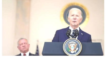
جو بایدن رئیس‌جمهور آمریکا گفت واشنگتن برای برقراری آتش‌بسی ۶ هفته‌ای در نوار غزه تلاشی می‌کند.

به گزارش خبرگزاری فرانسه، بایدن با اعلام سه‌شنبه پس از دیدار با عبدالله دوم شاه اردن در کاخ سفید اظهار کرد: آمریکا برای ایجاد توافق میان اسرائیل و حماس در مورد آزادی گروگان‌ها (اسرا) تلاش می‌کند. این توافق همچنین یک دوره آرامش فوری و پایدار که دستکم ۶ هفته خواهد بود، برقرار خواهد کرد. وی درباره طرح حمله زمینی رژیم صهیونیستی به رفح صراحتاً به گفتن این که غیرنظامیان باید محافظت شوند اکتفا کرد. ملوک عبدالله دوم نیز در گفتگو با خبرنگاران در کاخ سفید هشدار داد: حمله به رفح یک فاجعه انسانی دیگر ایجاد خواهد کرد. نمی‌توانیم کنار بایستیم و اجازه بدهیم این وضعیت ادامه پیدا کند. ما به یک آتش‌بس پایدار نیاز داریم. این جنگ باید تمام شود. بنیامین نتانیاهو نخست‌وزیر رژیم صهیونیستی به تلاشی اعلام کرد که عملیات زمینی در رفح ظرف دو هفته آینده آغاز خواهد شد. نخست‌وزیر رژیم صهیونیستی در ادامه گزاره گویهای خود خواستار نابودی گردان‌های نظامی جنبش حماس در رفح تا قبل از ماه رمضان شد. رژیم صهیونیستی برای تلافی حملات غافلگیرکننده طرفان الاقصی و جبران شکست خود توقف عملیات مقاومت، تمام‌گدرگاه‌های نوار غزه را بسته و در حال بمباران این منطقه است.