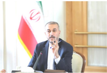
وزیر امور خارجه گفت: امنیت کشورهای منطقه دغدغه مشترک تهران و دمشق است.

رئیس‌جمهور ایران سالروز پیروزی انقلاب اسلامی را تبریک می‌گویم. مقدار افزود: هیات کشور دوست ما به ریاست آقای امیرعبداللهیان گفت و گوهایی طولانی را با آقای بشار اسد داشتند که در مورد موضوعات مختلف منطقه بویژه مقاومت قهرمانانه مردم فلسطین سخن گفتند. وی ادامه داد: جنایات اسرائیل باعث شده افکار عمومی جهان با حقیقت این رژیم آشنا شوند که به لطف مقاومت قهرمانانه مردم فلسطین صورت گرفته است. وی افزود: تاکید می‌کنم در منطقه هیچ اقدام رژیم صهیونیستی بدون پاسخ نمانده است. امروز نتانیاهو در با تلافی غزه گرفتار آمده است و غزه به قبرستان صهیونیست‌ها تبدیل شده است. گزینه‌ای جز راه حل سیاسی و توقف جنایات جنگی و نسل‌کشی در کرانه باختری وجود ندارد. امیرعبداللهیان تصریح کرد: ایران فعالانه برای توقف نسل‌کشی در غزه، باز شدن معابر ارسال کمک‌های انسان‌دوستانه و کوچ اجباری مردم غزه به صحرای سینای مصر مجدداً جلوگیری خواهد کرد. وی گفت: علیرغم خسارت‌ها در غزه در