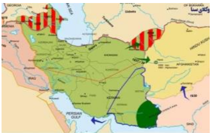
مناطق از دست رفته ایران در عهدنامه ترکمنچای

در اول اسفند ۱۲۰۶ شمسی یعنی ۱۹۸ سال پیش در چنین روزی ،یکی از وقایع تلخ ملت ایران که در خوی تجاوزی گری روسیه تزاری نشأت می گرفت در ترکمن چای آذربایجان ما به وقوع پیوسته است و پس از تحمل عهدنامه گلستان در آبان ۱۱۹۲ شمسی و جدا کردن ۱۴ ولایت و تصرف ۲۳۲ هزار کیلومتر مربع از سرزمین ایران بزرگ اینبار ،عهدنامه نکنجی دیگر روس ها بر ملت ایران تحمیل کردند که تیغات زبانبیار آن تاکنون هم ادامه دارد.روسها مردمی ناننجیب و متجاوز در طول تاریخ بوده‌اند و یا توجه به وسعت سرزمینی خود ،بروی هم رفته به آزار و اذیت و اشغال اراضی همسایگان خود روی آورده اند و در سده نوزدهم،امپراطوری آن برای دستیابی به انرژی و منابع زیر زمینی و معادن به بهانه های مختلف، کشورهای همسایه خود را موردتاخت و تاز قرار داده اند.بخش‌هایی از سرزمین های اطراف خود را تصرف کرده اند.حکومت های دست نشانده بوجود آورده‌اند و به غارت منابع انرژی و زیر زمینی و استحکام موقعیت های سیاسی و نظامی و سرزمینی روی آورده اند و امپراطوری روسیه را از سواحل ژاپن تا قفقاز شبه جزیره بالکان و همسایگی اول اروپایی گسترش داده‌اند که خدا را شکر با سیاست های گلاسنوست و پرسترویکای مخایل گورباچف، بخش های از سرزمین های تصرف شده از هم پاشیدند و ملل به استضعاف کشیده شده آزاد شده اند که متأسفانه سیاستهای بین‌المللی اجازه نداد که به سرزمین های،اصلی خود بپیوندینند.جمهوری های فعلی ارمنستان، آذربایجان،خودمختار نخجوان و گرجستان کنونی،از سرزمین به تاراج رفته ایران بلادیده با عهدنامه های چندش آور گلستان و ترکمن چای از مام وطن جدا شده اند که بررسی موشکافانه این رخدادهای تأسف بار گذشته